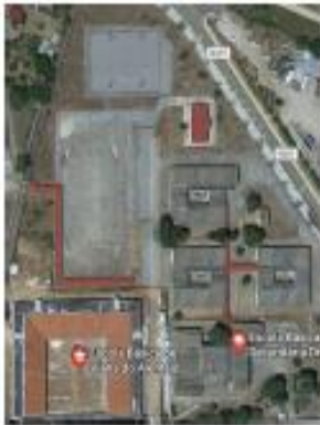
Img. 1 Fotografia aérea da escola.