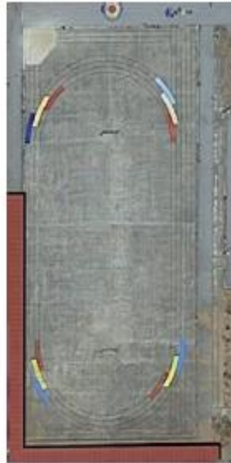
Img. 2 Fotografia aérea do campo exterior.