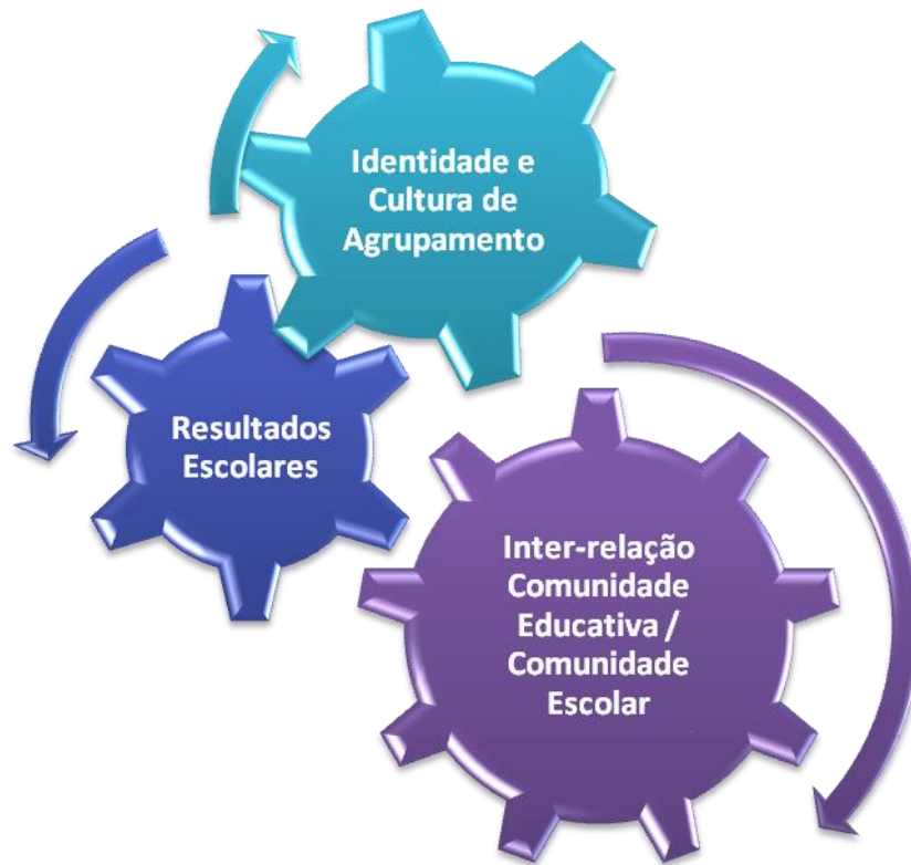
Figura 3 – Áreas de Intervenção

Assim, o PE-AEVA constitui-se em torno de três áreas de intervenção: