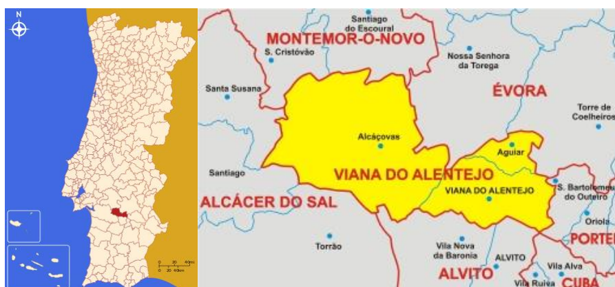
Figura 1 – Enquadramento geográfico

Trata-se de um concelho vincadamente rural, caracterizado pelo tipo de povoamento concentrado, definido pelas sedes de freguesia/concelho, envolvidas pela paisagem agro-silvo-pastoril, mas também com áreas incultas. A população ainda apresenta uma forte ligação à terra, com um modo de vida não citadino, onde a cultura e os costumes tradicionais e as relações de vizinhança se mantêm fortes. O concelho caracteriza-se por algum dinamismo económico, social, cultural e oferta de funções, equipamentos e serviços à população.